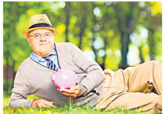
Das Sparschwein können Sie auf unserer Hörmesse zu Hause lassen.

Ein umfangreiches Angebot an Kopfhörern zum besseren Fernsehen und ein professionelles Programm über Gehörschutz für den Profi und Privatgebrauch runden die Messe ab.