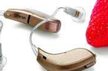
Die dänische Firma Oticon stellt ihr Hörgerät Agil vor, ein Stereohörgerät, das vor allem Musikliebhaber schätzen werden.