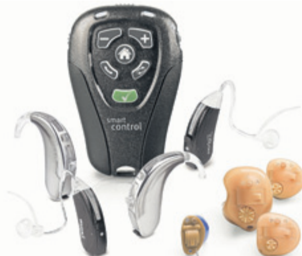
Die große Produktpalette von Unitron.