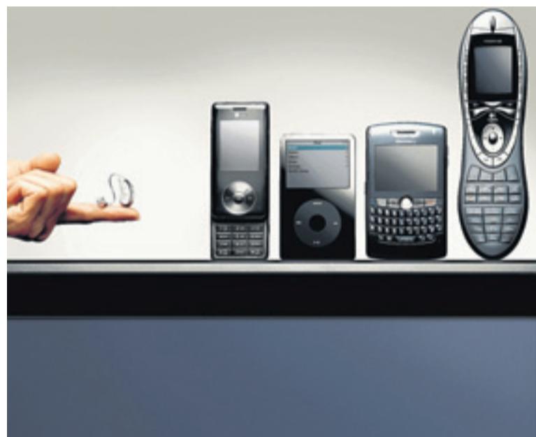
Via Bluetooth werden Telefonsignale, MP3-Player, Navigationssysteme und sogar Fernseher mit den Miniaturhörgeräten verbunden.

Allen Menschen, die unter Tinnitus leiden, stellt die Firma Westend-Hörgeräte ihr „Stuttgarter-Modell“ vor. Zubehör zum besseren Telefonieren und Fernsehen, sowie ein qualitativ hochwertiges Gehörschutzprogramm runden diese einmalige Messe ab!