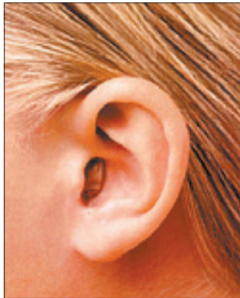
Das Siemens Nitro ist das stärkste Im-Ohr-Hörgerät der Welt.

Höhepunkte der Ausstellung sind von der Firma Oticon, das Epoq, es ist das erste bluetooth Stereohörgerät. Mit Hilfe eines so genannten Streamers kann man dieses Hörgeräte direkt mit Fernseher und Telefon verbinden, von der Firma Unitron, das Yuu Moxi, das erste interaktive Hörgerät, mit dem Sie selber über eine Fernbedienung