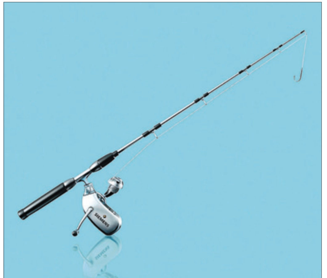
Die Firma Siemens stellt das Hörgerät „Centra Active“ vor. Das Centra ist das wohl beste Hörgerät für alle Menschen, die von so genannten Nebengeräuschen belästigt werden. Dieses Hörgerät ist spritzwassergeschützt, das ideale Hörgerät für aktive Menschen. Batterien werden für das Centra-Active auch nicht mehr benötigt, da es mit einem Ladegerät betrieben wird.

Die Firma GN-ReSound stellt mit dem DOT das kleinste HdO-Hörgerät der Welt vor. Für alle hochgradig schwerhörigen Besucher stellt die Firma Siemens das CIC-Hörgerät Nitro vor. Das Nitro ist das stärkste CIC-Hörgerät der Welt für alle Menschen die