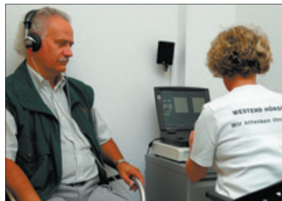
Nach dem Hörtest bei Westend-Hörgeräte weiß man genau Bescheid.

Jeder Interessent erhält an den beiden Tagen einen kostenlosen Hörtest, mit dem er dann an den verschiedenen Ständen sich Informationen über die