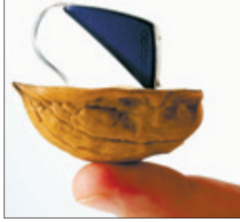
Das „Delta“ ist ein Hörgerät, das wegen seiner einzigartigen Form einfach nicht wie ein herkömmliches Hörgerät aussieht.

Weitere Höhepunkte ist von der Firma Unitron das „Indigo Moda“, von der Firma Phonak das „microPower“, das da ansetzt, wo das „Delta“ von Oticon zu schwach ist, damit endlich auch Schwerhörige mit großem Hörverlust auf einen herkömmlichen Schallschlauch verzichten können. Die Firma Siemens stellt das Hörgerät „Centra Active“ vor.