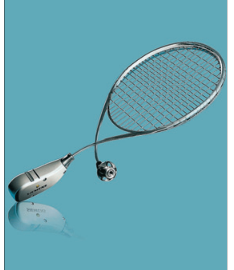
Die Firma Siemens stellt das Hörgerät „Centra Active“ vor. Das Centra ist das wohl beste Hörgerät für alle Menschen, die von so genannten Nebengeräuschen belästigt werden.