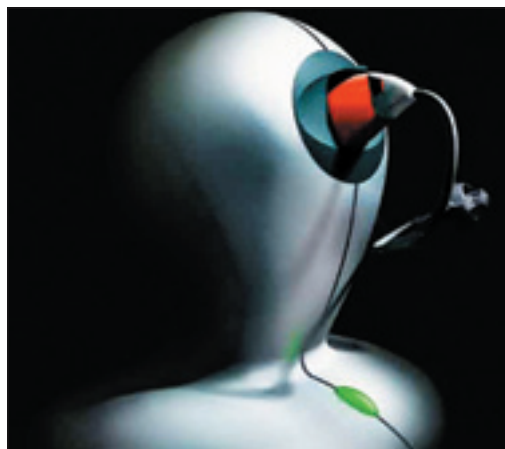
Die Hörgeräte „Centra Active“ und „Pulse“ (Bild) werden mit Akkuzellen betrieben. Über ein spezielles Ladegerät werden die Hörgeräte über Nacht geladen und sie benötigen keine Batterien mehr!