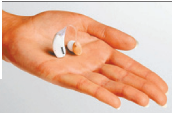
Von der Firma Phonak wird das „microPower“ präsentiert.

Hören im Jahr 2007 halten. Allen Menschen, die unter Tinnitus leiden, stellt die Firma Westend-Hörgeräte ihr „Stuttgarter Modell“ vor. Zubehör zum besseren Telefonieren und Fernsehen sowie ein qualitativ hochwertiges Gehörschutzprogramm runden diese einmalige Messe ab.