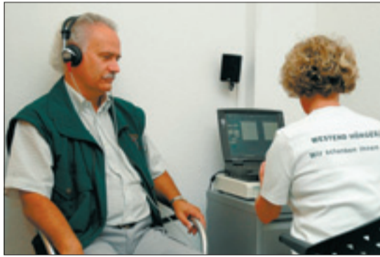
Hörtest bei Westend-Hörgeräte