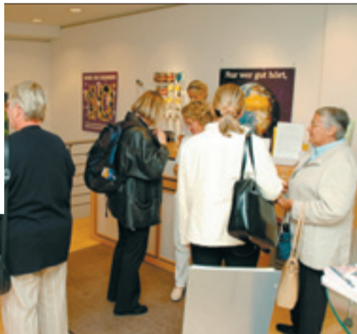
Starker Andrang herrschte bei der letzten Messe.