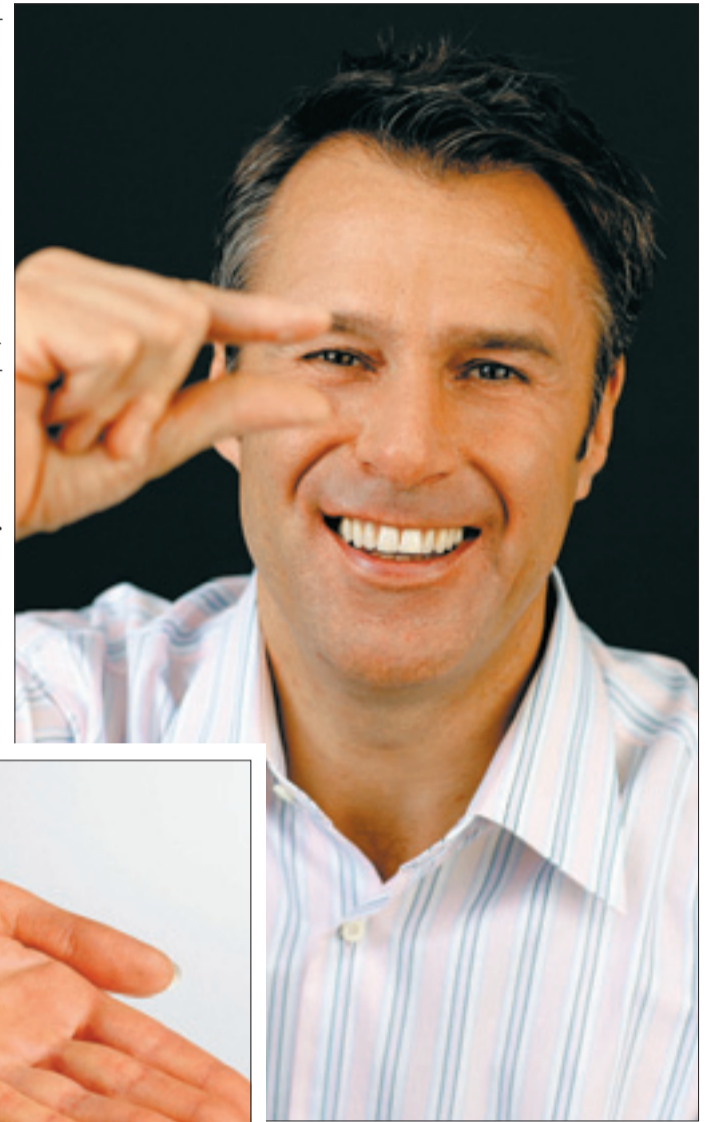
Sooo klein sind die heutigen Hörgeräte. Klein, aber mit viel Power.

Allen Menschen die unter Tinnitus leiden, stellt die Firma Westend-Hörgeräte ihr „Stuttgarter-Modell“ vor. Zubehör zum besseren Telefonieren und Fernsehen, sowie ein qualitativ hochwertiges Gehörschutzprogramm runden diese einmalige Messe ab!