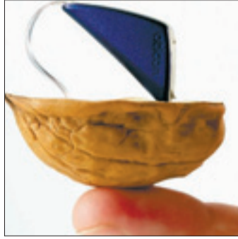
Das Delta passt in eine Walnuss-Schale.

Jeder Interessent erhält an den beiden Tagen einen kostenlosen Hörtest mit dem er