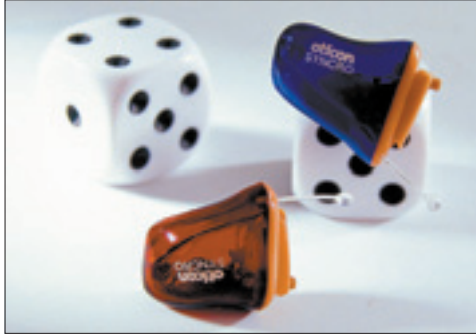
Die neue Hörgerätegeneration ist kleiner als ein Würfel.

Dieses Jahr soll der Schwerpunkt der Ausstellung einer neuen Generation von Hörgeräten gewidmet werden. Sie werden zwar hinter dem Ohr getragen, haben aber eine