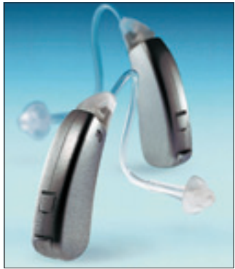
Das fast unsichtbar zu tragende Einsteigermodell „Acuris life“.