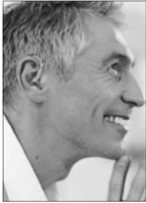
Selbstbewusste Hörgeräteträger durch digitale Technik.