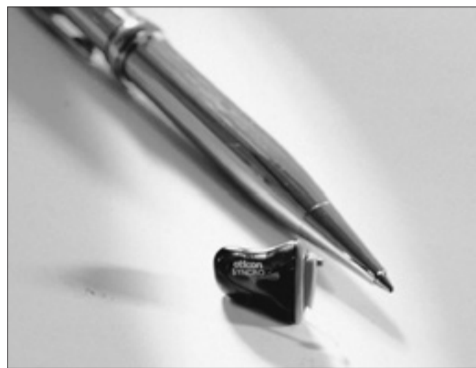
Klein wie die Spitze eines Kugelschreibers – Das Modell „Syncro“ der Firma Oticon, ein Höhepunkt der Ausstellung bei Westend-Hörgeräte.